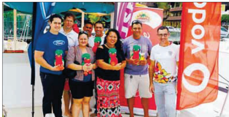
Les organisateurs de la première édition du Papeete International Sevens ont organisé une conférence de presse hier matin pour présenter ce nouveau tournoi de rugby à 7.