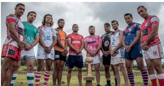
Présentation du trophée autour des capitaines. De gauche à droite, Papeete A, Los Lobos, Matamu'a A, Punaauia, Chile All Stars, Tercer Tiempo, Arue, Mano Barbarians, Matamu'a B, Papeete B.