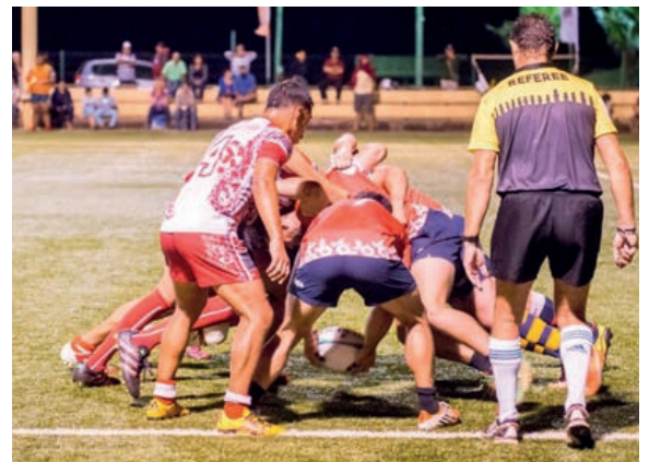
Papeete A en finale face aux Chile All Stars.

Durant le tournoi, les deux autres clubs du fenua ont fini à la sixième place pour Punaauia et au cinquième rang pour Arue, qui a longtemps tenu tête aux All Stars en match de poule.